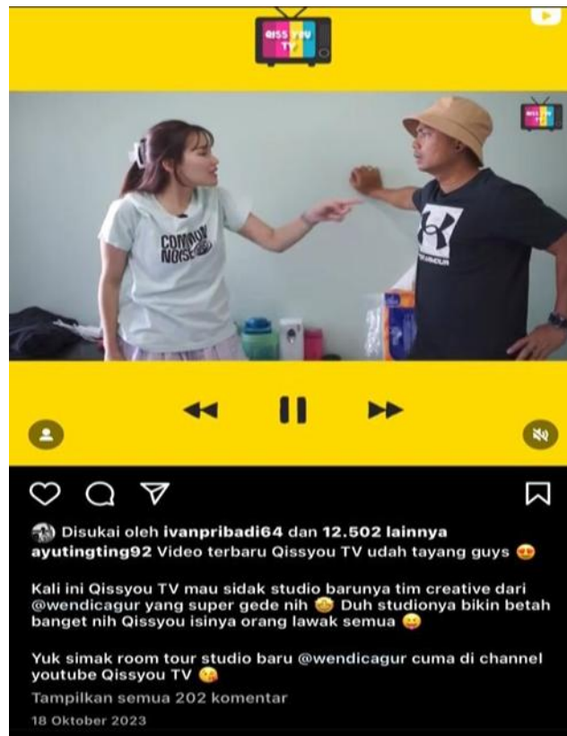
Gambar 2. Temuan Kesalahan Penggunaan Afiksasi