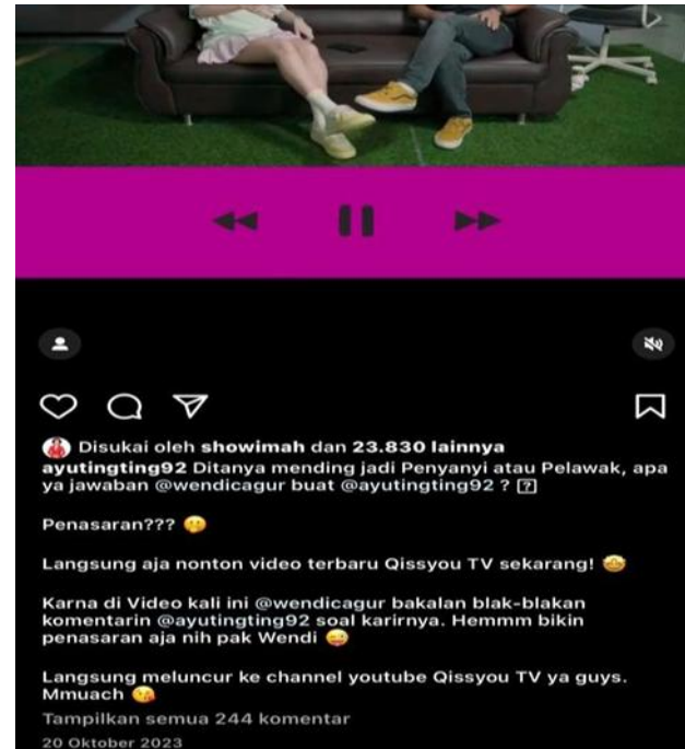
Gambar 3. Temuan Kesalahan Penggunaan Afiksasi